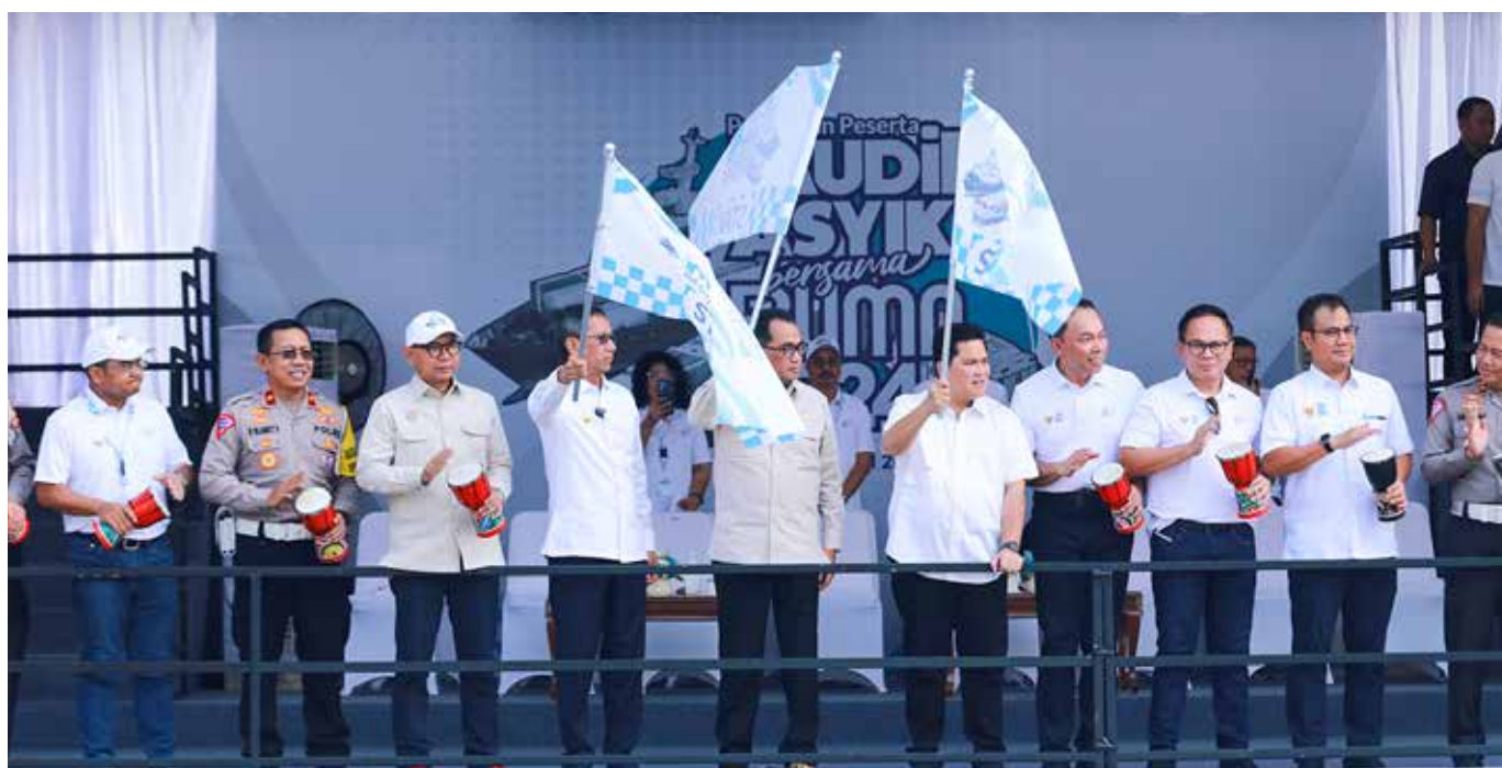
Pj Gubernur Jakarta, Heru Budi Hartono bersama Menteri Perhubungan, Budi Karya Sumadi, dan Menteri Badan Usaha Milik Negara (BUMN), Erick Thohir, melepas peserta mudik secara seremonial mengibarkan bendera dalam acara pelepasan peserta “Mudik Asyik Bersama BUMN 2024” yang diselenggarakan di Silang Monas, Jakarta, Jumat, (5/4/2024).