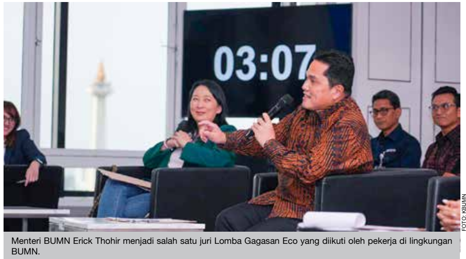
Menteri BUMN Erick Thohir menjadi salah satu juri Lomba Gagasan Eco yang diikuti oleh pekerja di lingkungan BUMN.