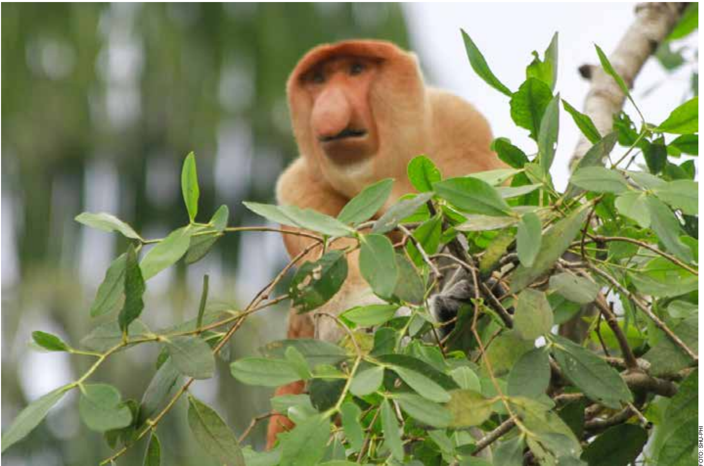
PEP Sangasanga Field berhasil mengembangkan Kelompok Sadar Wisata dan Ekowisata (Pokdarwis) berbasis pelestarian bekantan di Sungai Hitam, Kalimantan Timur.