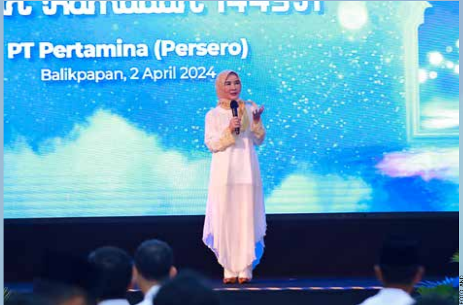
Direktur Utama Pertamina, Nicke Widyawati, memberikan sambutan dalam Safari Ramadan 1445H yang diselenggarakan di Club House Gn Utara PHM, Balikpapan, Kalimantan Timur, Selasa, (2/4/2024).

Dalam kesempatan tersebut, Nicke menyampaikan bahwa Pertamina menerapkan strategi pertumbuhan ganda untuk mempertahankan kebutuhan energi nasional, yakni memperkuat dan memperluas pengelolaan bisnis minyak dan gas existing dan pada saat bersamaan mengembangkan bisnis berkarbon rendah sebagai penggerak pertumbuhan di masa depan.