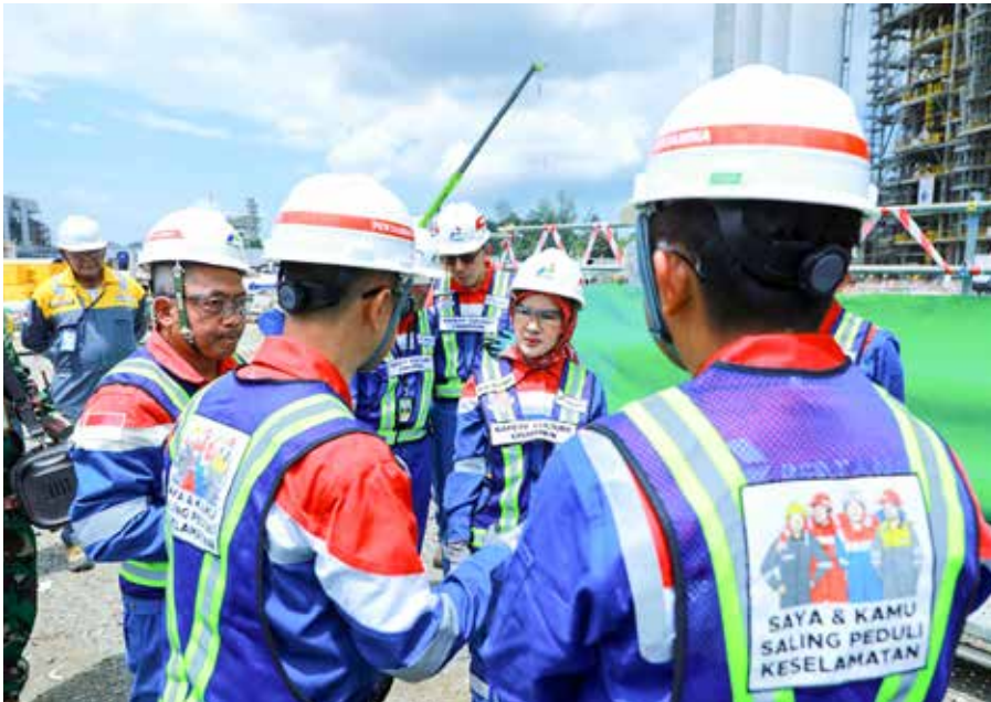
Direktur Utama Pertamina, Nicke Widyawati meninjau Proyek RDMP Balikpapan dalam rangkaian Safari Ramadan 2024, (2/4/2024).

proyek ini karena sudah ditunggu-tunggu oleh seluruh masyarakat Indonesia. Proyek ini akan memberikan nilai tambah yang besar untuk perekonomian Indonesia. Pertamina bangga memiliki proyek sebesar ini," ungkap Nicke.