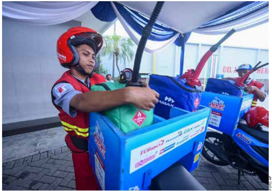
Dua Motoris Pertamina Delivery Service (PDS) sedang melakukan persiapan jelang arus mudik di SPBU Pertamina Ngagel 54.601.100, pada Kamis, (4/4/2024).

“Keakuratan dispenser yang ada di SPBU benar-benar baik jadi saya rasa baik dari sisi Terminal BBM-nya maupun SPBU-nya