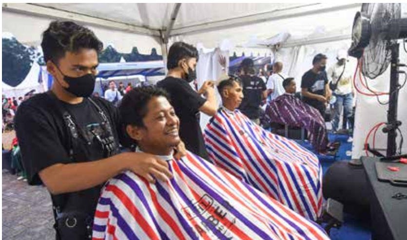
Peserta program “Mudik Asyik Bersama Pertamina 2024” mencoba salah satu fasilitas potong rambut yang disiapkan.

“Alhamdulillah, saya mau mudik ke Yogyakarta bersama suami, anak, dan cucu saya. Saya suka fasilitas pijatnya, terus nemenin cucu main dan mewarnai di area bermain. Saya tahu mudik gratis ini lewat Instagram. Terima kasih Pertamina. Semoga sukses selalu, maju terus. Semoga tahun depan lebih banyak lagi,” tutupnya. •PTM