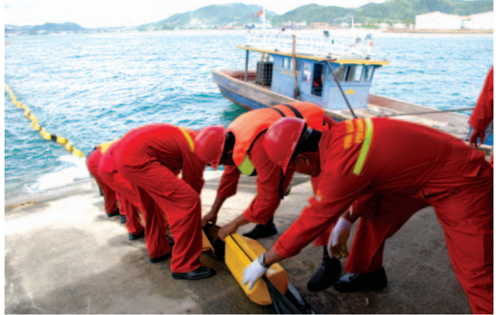
Tim Penanggulangan Keadaan Darurat (TPKD) Pertamina Sumbagsel bergerak cepat dalam latihan oil spill yang dilakukan di perairan Panjang sehingga tidak terjadi pencemaran terhadap air laut di sekitar perairan tersebut, (27/11).

LAMPUNG - Pada 27 November 2008 terjadi kebocoran di jalur pipa produk BBM yang ditemukan oleh petugas sekuriti Depot Panjang, Lampung, yang sedang berpatroli. Kebocoran ini mengakibatkan semburan minyak dari pipa yang bocor di perairan sekitar dermaga Depot Panjang. Setelah melapor kepada Loading Master dan diteruskan kepada Operation Head Depot, maka di bawah komando P3 (Penerimaan, Penimbunan dan Penyaluran) Depot, Tim Penanggulangan Keadaan Darurat (TPKD) segera bergerak untuk melakukan perbaikan pipa yang bocor dan melokalisasi tumpahan minyak di perairan dengan menggunakan kapal dan oilboom . Setelah tumpahan minyak dapat dilokalisasi, maka minyak yang tumpah tersebut dihisap kembali dengan menggunakan skimmer dan perairan dermaga telah dinyatakan aman dan bersih dari ancaman pencemaran